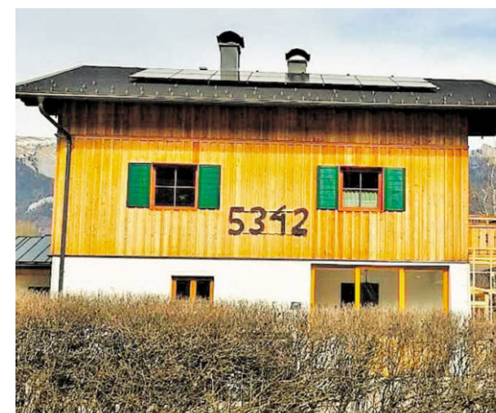
Dieser Aberseer an der Wolfgangseestraße hat kurzerhand die gewohnte Postleitzahl auf seine Fassade montiert.

Befürworter einer Änderung zu 5350 Strobl kämen aus dem Tourismus, erklärte Bürgermeister Josef Weikinger. Abersee finde man im Internet schwer, ebenso im Zentralen Melderegister.